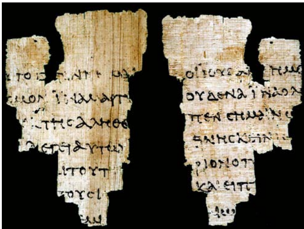
Le fragment de John

L'un peut dire qu'il y avait des fragments plus anciens prouvant que la Bible existait durant une têt âge. Le fragment de John Ryland datant à environ 125 ap. J-C et contenant quelques mots dans l'évangile de Jean est la plus célèbre exemple. Voyons comment ce fragment ressemble: